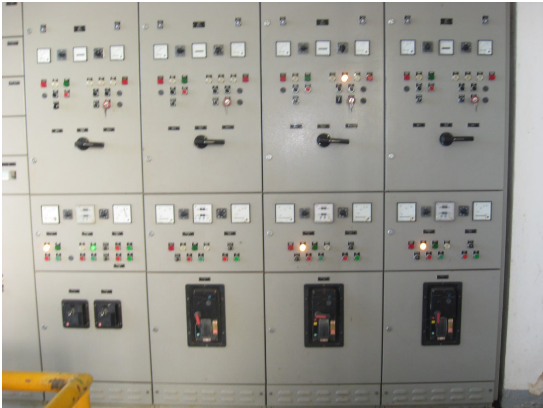
Figura 1 Art. IMPIANTO SAN VERO MILIS : Rimozione avviamento stalla/triangolo -installazione di softstarter