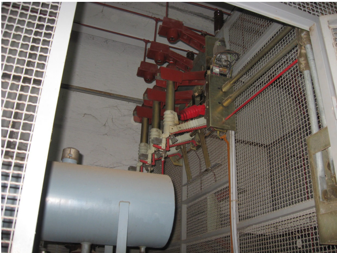
Figura 4- IMPIANTO DI SIMAXIS sostituzione sezionatori