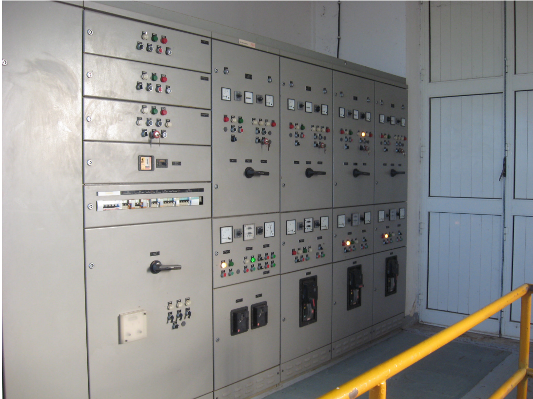
Figura 6 IMPIANTO DI DONIGALA - centralina di telecontrollo