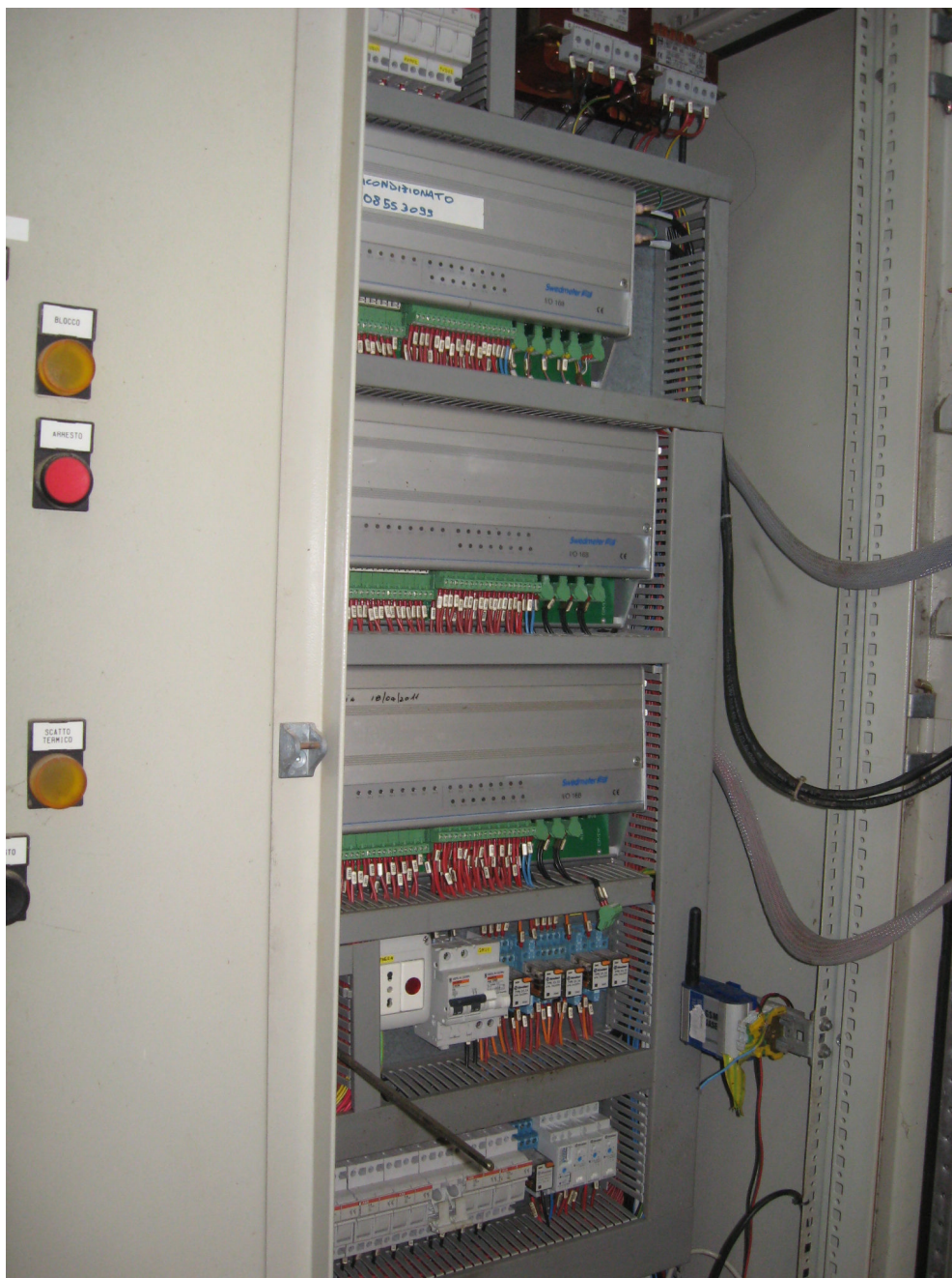
Figura 5 - IMPIANTO DI SANTA MARIA centralina di telecontrollo